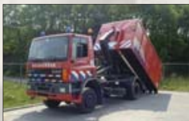
Der LKW lädt den für die jeweilige Gefahrenlage bestückten Absetzcontainer

In den Containern lagert das Rettungsmaterial in Kunststoffbehältern verpackt. Die Engels-Gruppe erhielt den Auftrag, die Behälter mit dem entsprechenden Interieur zu liefern. Damit sind unsere RAKO-Behälter Standardausrüstung der niederländischen Feuerwehr.