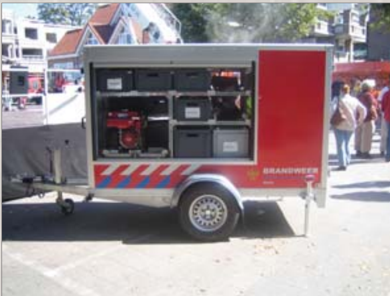
Und auch in den Anhängern ist immer Platz für Kunststoffbehälter

Früher wurden unsere Behälter den räumlichen Gegebenheiten in den Fahrzeugen in Maßarbeit angepasst (z.B. durch aufsägen und neu verschweißen auf die richtige Länge gebracht). Die Fahrzeughersteller passen ihre Aufbauten heute den Euronormmaßen an, so dass wir den Behältern nur noch den „Feinschliff“ geben. Wir montieren beispielsweise verstärkte Handgriffe und Etikettenhalter oder versehen die Behälter mit dauerhaften Beschriftungen.