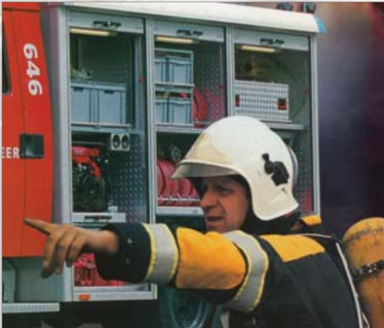
In jedem Einsatzfahrzeug werden Kunststoffbehälter gebraucht

Früher wurden unsere Behälter den räumlichen Gegebenheiten in den Fahrzeugen in Maßarbeit angepasst (z.B. durch aufsägen und neu verschweißen auf die richtige Länge gebracht). Die Fahrzeughersteller passen ihre Aufbauten heute den Euronormmaßen an, so dass wir den Behältern nur noch den „Feinschliff“ geben. Wir montieren beispielsweise verstärkte Handgriffe und Etikettenhalter oder versehen die Behälter mit dauerhaften Beschriftungen.