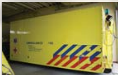
Nicht nur die Feuerwehr, auch größere regionale Krankenhäuser haben ihre eigenen Notfallcontainer (z.B. UMG -NL)