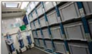
RAKO Behälter mit Verbandstoffen in einem medizinischen Notfallcontainer