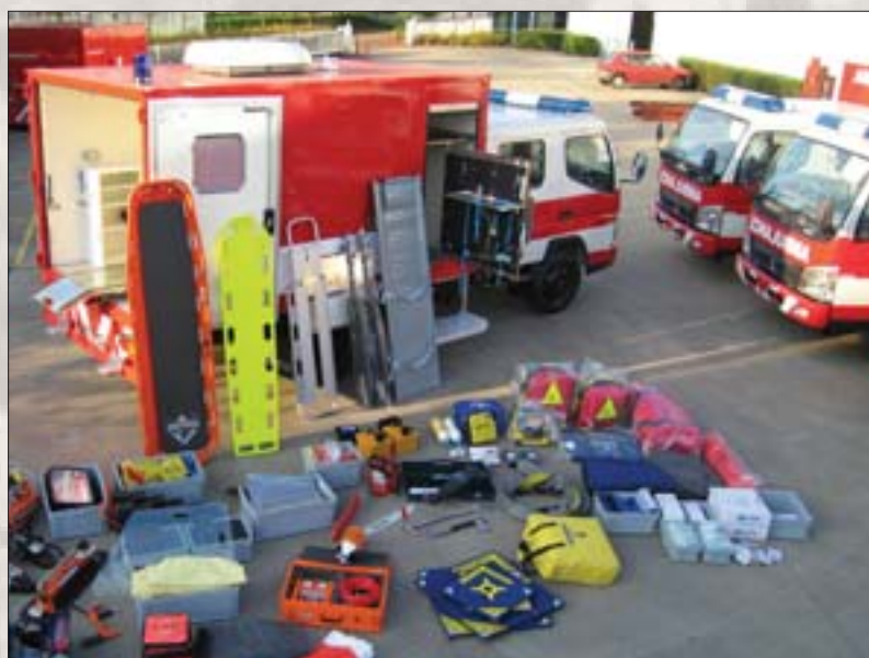
Inhalt eines Rettungscontainers, der mit einem Flugzeug in Katastrophengebiete geflogen wird

Durch die standardisierte Einrichtung können die Kameraden aller Feuerwehrcorps mit geschlossenen Augen das benötigte Material in den Containern finden. Stress ist im Katastrophenschutz unvermeidbar. Wenn man aber die benötigte Ausrüstung schnell zur Hand hat, kann man seine ganze Konzentration auf seine Arbeit legen. Und das ist was Wichtig ist.