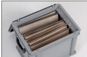
Durch die eingienieteten Aluschienen sind unsere Koffer für Hängemappen im DIN-A4-Format geeignet - ein tragbares Hängeregister