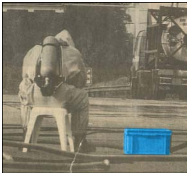
Beim Unfall mit gefährlichen Substanz, RAKO Behälter mit Hilfematerial

Offt, wenn Polizei oder Hilfsdiensten im Rundfunk erscheinen, sind unsere Behälter auch im Bild. Wenn es geht um Transportverpackung von Beweisstücken oder Kisten mit Hilfematerial, wir sind immer ein bisschen stolz wann wie sie entgegen kommen.