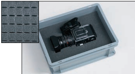
Blockschaumplatten, Perforation 20x20 mm. Durch das Abtrennen von Blöcken gestalten Sie Ihre Verpackung nach Maß.