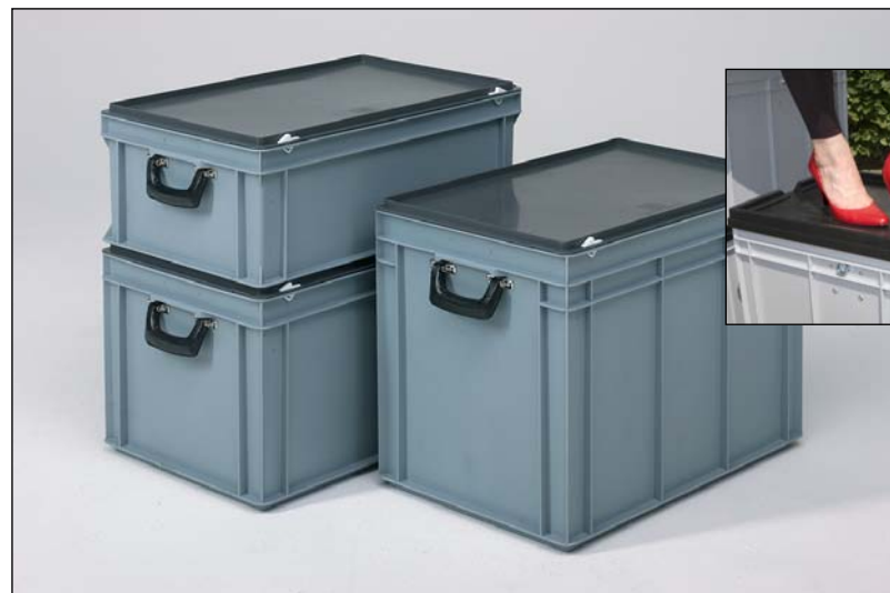
RAKO Koffer Heavy Duty