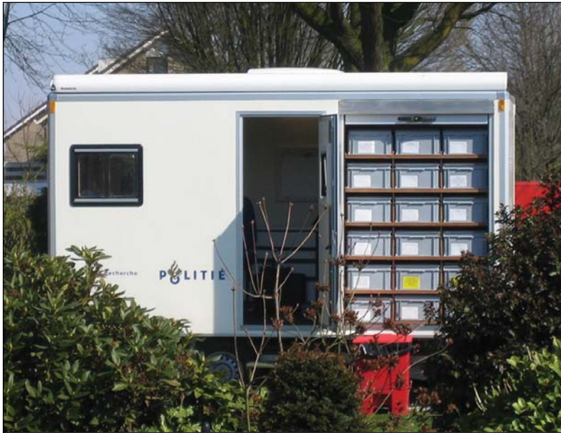
MobilPlatz Verkehrspolizei mit RAKO behältermagazin und rote Industriequalität Großmüllbehälter.

RAKO Behälter werden durch ihr starren Konstruktion und viele Zubehör (elbstklebenden Etikettenhaltern, selbstklebenden Magnetischen Felder, Barkoderung, Versiegelungen, Versiegelungen mit Barkoderung und Emblem) mindestens ebe so oft eingesetzt vor Lager-, als vor Transportzielen. Sehe hiruten.