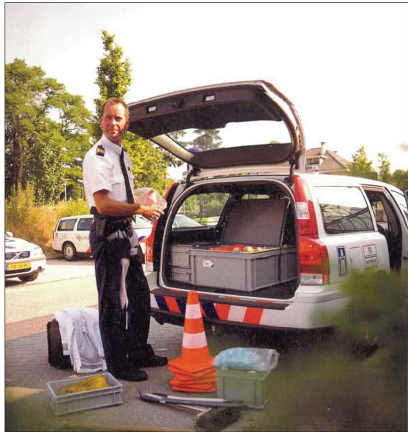
Alles passt in RAKO Behälter, wie Sie im oben stehend Bild sehen.