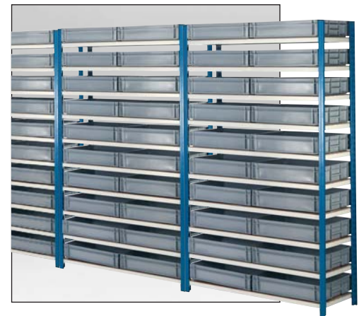
Beweismaterialarchiv. RAKO Behälter sind zu versiegeln und deshalb geeignet ala Lagerkaste und Versandeinheit.