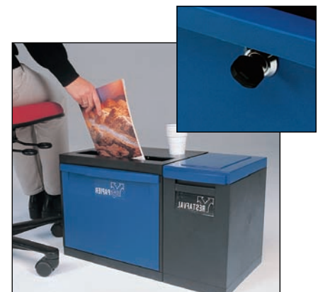
Mülltrennungsmodul „Restmüll und vertrauliches Papier“ bei welchen die Papiereinheit optional abschließbar ist.