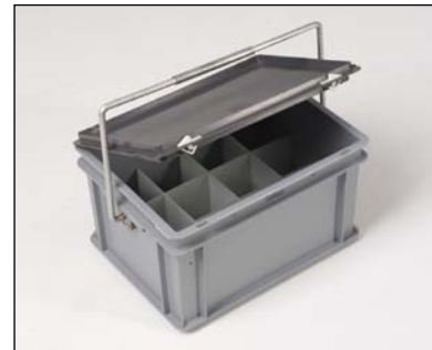
Behälter mit Fachteilung gebraucht bei das Training die Polizeihunden für Lager die Geruchmuster.

Echte Speziale für die Polizei haben wir noch nicht im Programm. Wir haben schon, für uns, standard Behälter und Großbehälter den die Polizei und Justiz ihren eigenen Anwendungen gefunden haben. Sehe mal herunten.