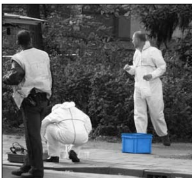
RAKO Behälter mit Werkzeug der Forensischen Diensten.

RAKO Behälter und Koffer leihen sich ausgezeichnet für aufräumen und mitnehmen einer große Varietät an Material: Sie sind stark, modular stapelbar und gewünscht abschließbar. Auch sind sie im Kofferausführung lieferbar, „standard“ und „heavy-duty“.