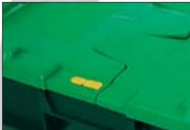
Versiegelung (hier die AL04).

Durchdachtes System: unsere Siegel lassen sich ohne Verwendung von Messer oder Zange einfach entfernen. Wenn ein höheres Sicherheitsniveau gewünscht ist, versehen wir die Versiegelungen mit Ihrem Firmenlogo und/oder laufenden Nummern bzw. Barcodes.