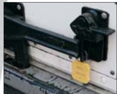
Aerolock™ versiegelter Lkw.