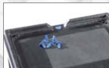
RAKO-Behälter mit diebstahlgeschütztem Deckel, 2 Einstecksiegel.