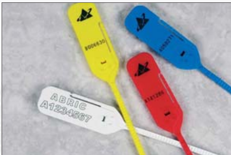
Riblock™ Verschlüsse mit doppelseitiger Verzahnung.

Riblock™ ist durch die doppelseitige Verzahnung besonders betrugsicher. Durch die Form der Verzahnung kann der Verschluss ergonomisch angebracht und durch die „Side Tear off“-Abtrennlinie einfach entfernt werden. In den Farben Rot, Blau, Weiß, Grün und Gelb erhältlich. Lieferung einzeln oder in Matten mit 5 Stück, 1000 Siegel pro Karton. Band 5,5 mm breit, 2,2 mm dick.