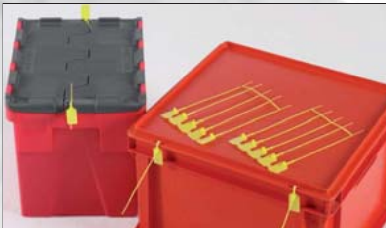
Lightlock™ Siegel, z.B. für Transportbehälter und Feuerlöscher.

Sorten: Jawlock™ und Smoothlock™ mit Stahlmechanismus, Securelock™ mit Mechanismus aus Acetal. Festigkeit für Temperaturen zwischen -20°C und +80 °C.