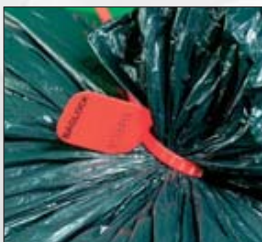
Riblock™, Baglock™ oder Smoothlock™, Schließen und Versiegeln in einem Arbeitsgang.