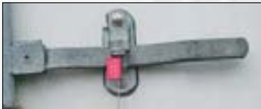
Alulock™ in der Praxis.