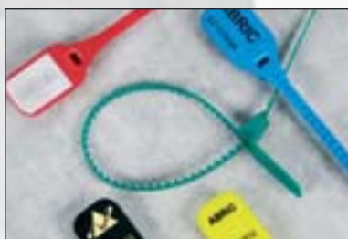
Baglock™, Säcke schnell und einfach verschließen.

Baglock™, einfache, kräftige Bandversiegelung mit einseitiger Verzahnung. Farben wie bei Riblock™. Lieferung in Matten mit 5 Stück, 1000 Siegel pro Karton.