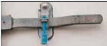
Unolock™, Zugfestigkeit bis zu einer Tonne

Das sicherste Schlossiegel aus unserem Sortiment ist das Unolock™. Es ist vom Zoll des Vereinigten Königreichs zertifiziert worden und neutral oder mit Aufdruck lieferbar. Die Nummern auf dem Gehäuse und dem Verschlussbolzen stimmen als zusätzliche Sicherheit überein. Das Gehäuse und der Verschlussbolzen sind mit Kunststoff (SAN) beschichtet, sodass Beschädigungen sofort sichtbar sind.