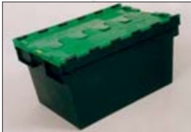
Behälter mit zweiteiligem Deckel.

Unsere Versiegelungen passen für alle bekannten Marken von Distributionsbehältern (auch falt- und nestbare). Damit erkennt der Empfänger auf einen Blick, ob sich jemand am Behälterinhalt zu schaffen gemacht hat.