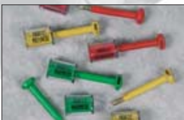
Unolock™ kann nur mit einem Bolzenschneider geöffnet werden!