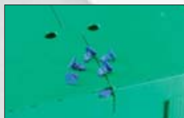
Faltbarer Behälter mit 2 Einstecksiegeln.