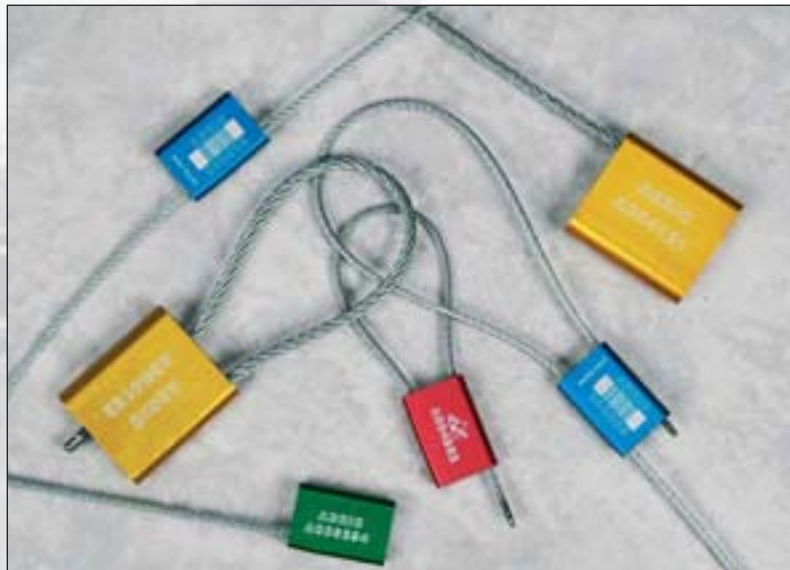
Alulock™ Vorhängeschloss-Siegel aus Aluminium/Stahl.

Wenn das Siegel nur mit einem Seiten- oder Bolzenschneider geöffnet werden soll, empfehlen wir Ihnen das Alulock™ oder das Unolock™. Die beiden Modelle können bei Temperaturen zwischen -40°C und +120°C eingesetzt werden. Bei dem Alulock™ steht die Wicklung des Kabels unter Spannung. Sobald es aufgeschnitten wird, weisen die Drähte in alle Richtungen, sodass das Schloss nicht mehr geschlossen werden kann. Die Schlossgehäuse vom Alulock™ sind schwarz, weiß, blau, grün, rot oder goldfarben beschichtet und mit Barcodes versehen. Verpackung: Alulock™ 2.0 und 2.5 jeweils 250 Stück pro Karton, Alulock™ 4.0 100 Stück pro Karton.