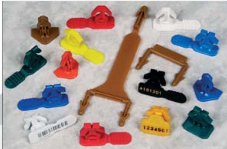
Arrowlock-Versiegelungen für Distributionsbehälter.

Versiegeln? Ist nicht nur wegen der Gefahr eines Diebstahls, sondern auch wegen der Produkthaftung wichtig. Wenn Ihre Sendung geöffnet wird, wollen Sie sicher sein, dass sich genau das darin befindet, was Sie hineingetan haben.