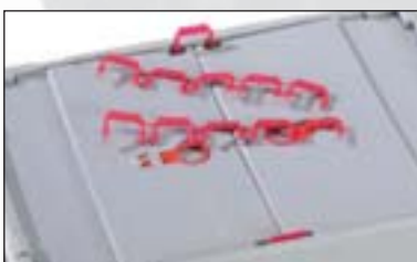
Faltbarer Behälter mit zwei Siegeln in U-Form.