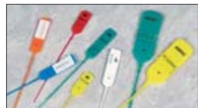
Jawlock™ und Mini Jawlock™ - Siegel