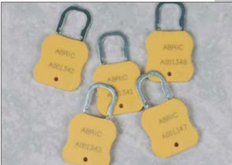
Aerolock™ Siegel – mit einem leichten Vorhängeschloss vergleichbar.

Wir informieren Sie gern über die lieferbaren Größen!