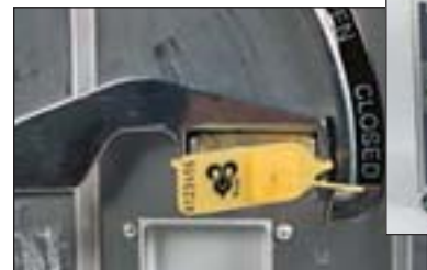
Cateringwagen mit Jawlock™ Siegel.

Ganz besonders in der Luftfahrt wird das Thema Sicherheit großgeschrieben. Kriminelle und Terroristen versuchen ständig, Sicherheitsvorkehrungen zu umgehen. Für den Einsatz in dieser anspruchsvollen Umgebung liefern wir die Jawlock™ Versiegelungen.